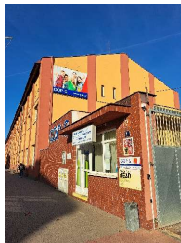
Obrázek: Vstup do školy

Nejvyšší povolený počet žáků ve škole: 800