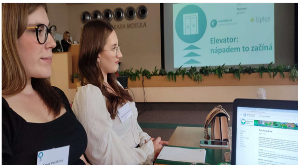
Obrázek: Elevator – nápadem to začíná