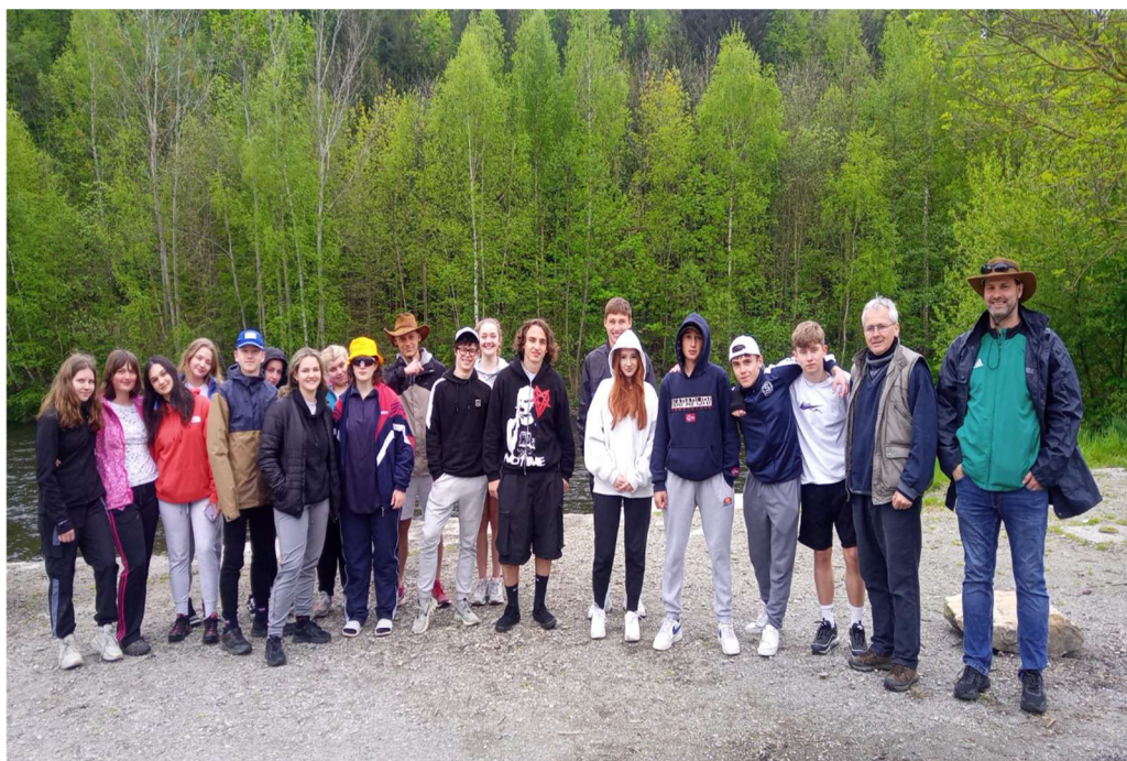
Obrázek: Vodácký kurz