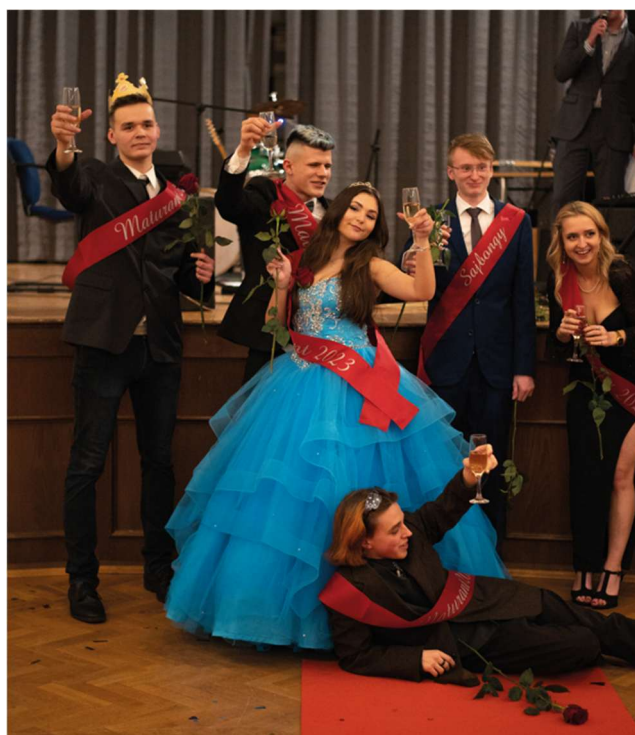
Obrázek: Maturitní ples