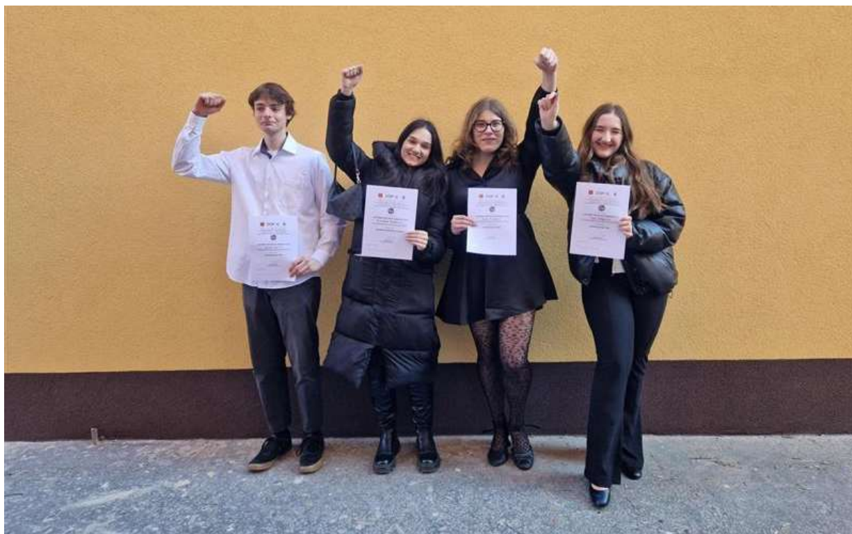
Obrázek: Konference Enersol 2023