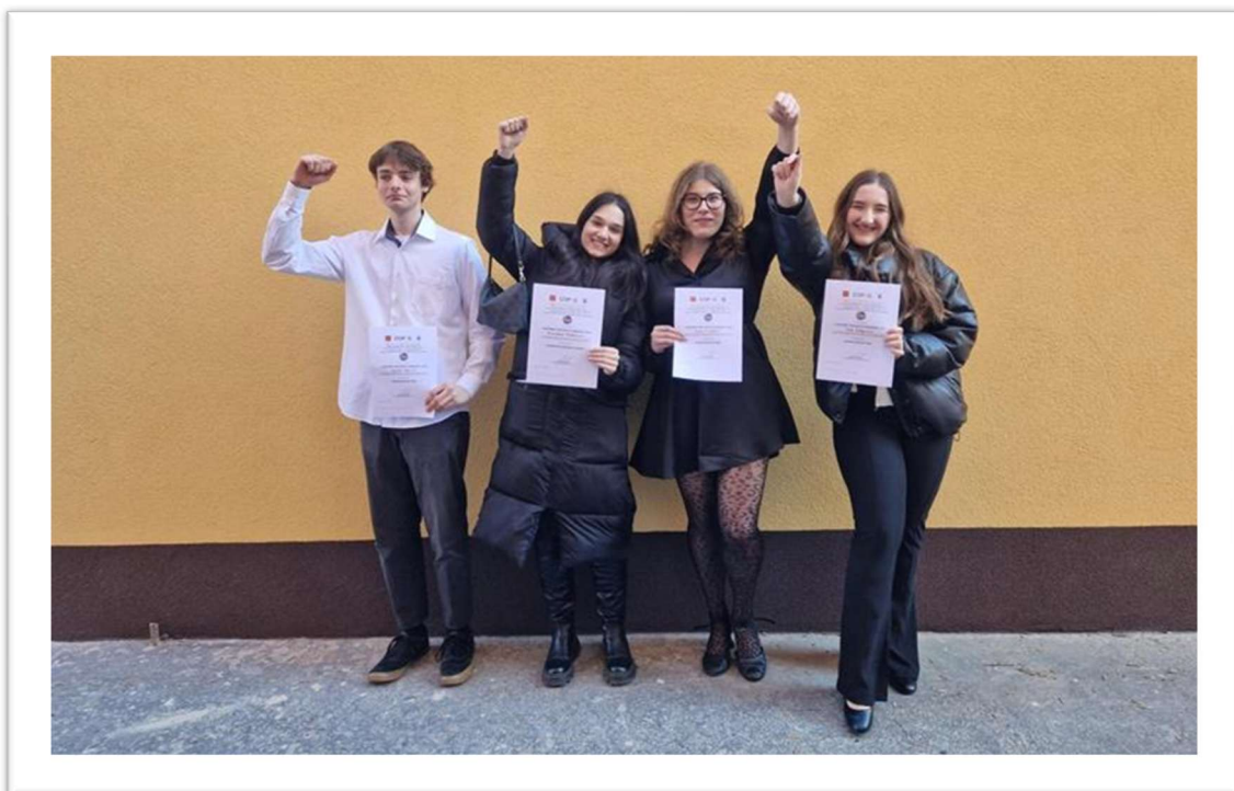
Obrázek: Konference Enersol 2023