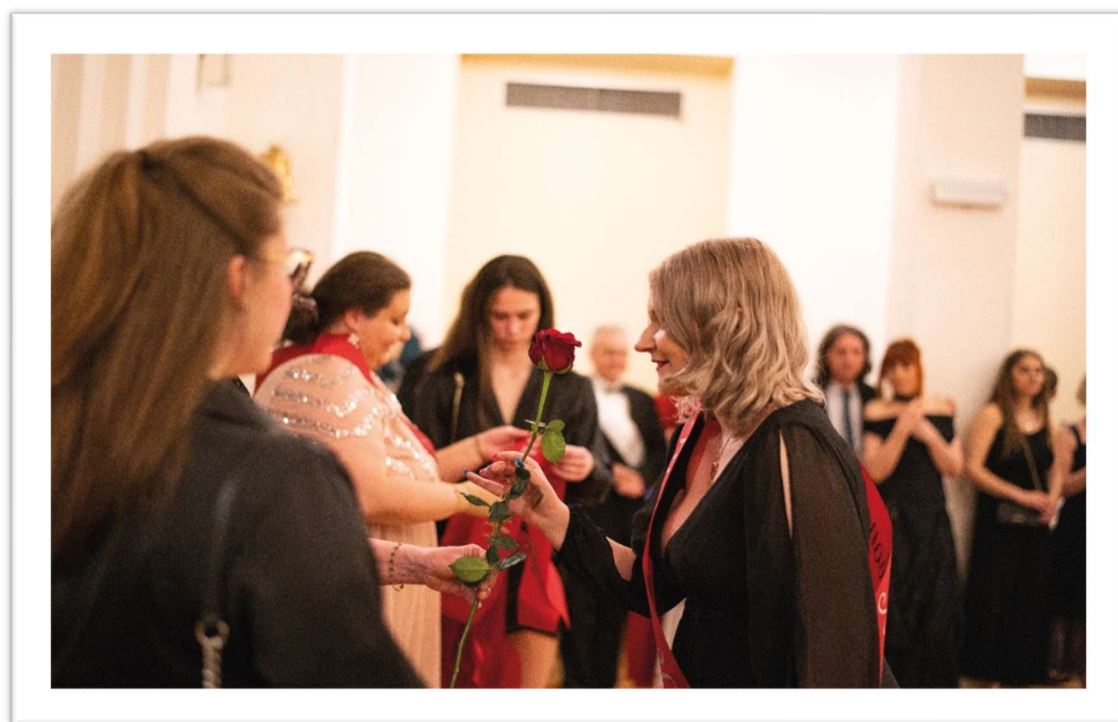
Obrázek: Maturitní ples