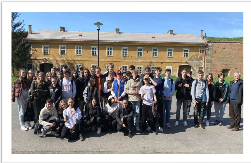
Obrázek: Exkurze Terezín